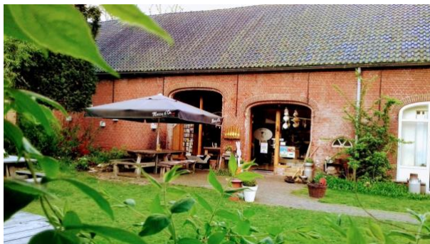
Boerderij Den Hof Buitenlust 14661 AL HALSTEREN

Deelname aan de tochten geschiedt op eigen risico. ARSV THOR aanvaardt geen aansprakelijkheid voor niet-THORleden.